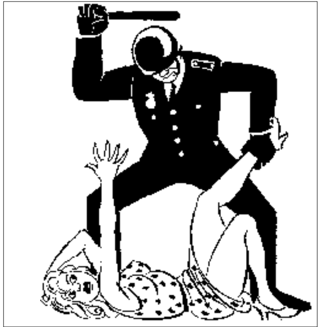
Illustration af Herluf Bidstrup i forbindelse med protestdemonstration foran USA's ambassade i København. Betjenten går åbenbart ind for kønnes ligestilling

Modstanderne af atomkraft er kommunister, politiske plattenslagere, pseudo-maxistiske skrålhalse, brøndkarsespisende kystbanesocialister.