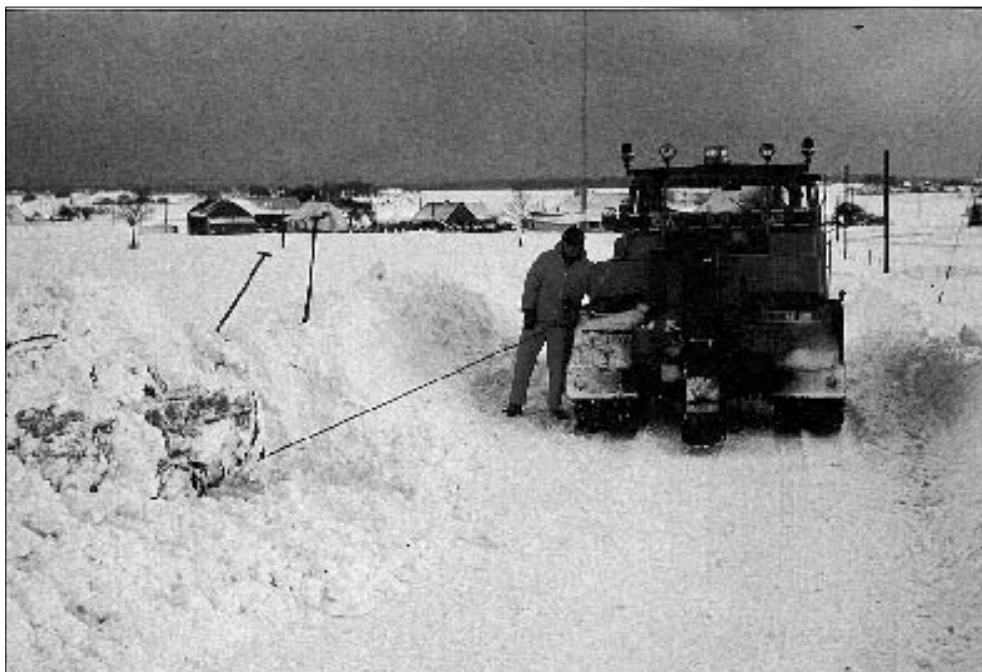
Torben Høyer Hansen

Billedet er fra 1997, hvor der faldt store mængder sne fulgt af en kraftig snefygning.