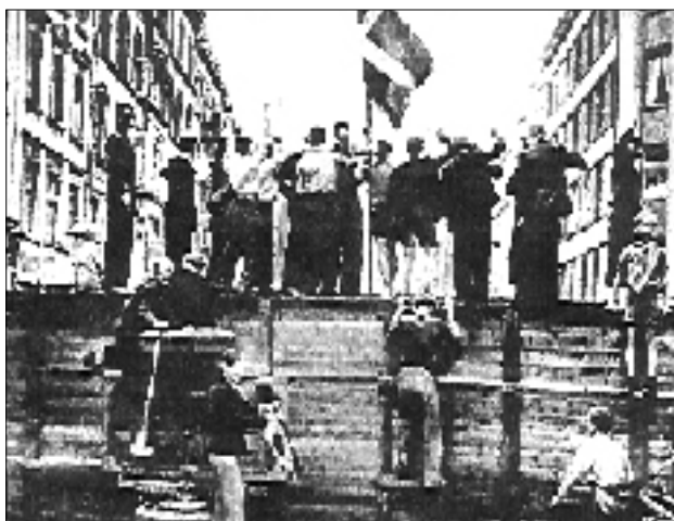
Barrikaderne her stammer fra Nørrebrogade i København.

Alt brændbart, som man kunne skrabe sammen, var lystige flammende bål på barrikaderne i den lyse sommeraften.