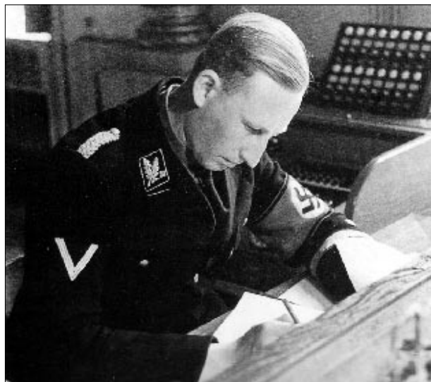
Heydrics rædselregimente i protektoratet Tjekko-Slovakiet bevirkede, at han blev likvideret.