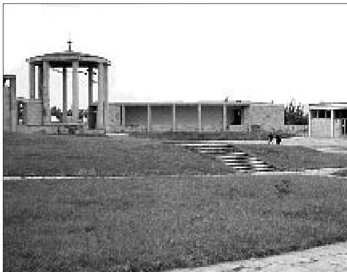
Som hævnakt udslettede man landsbyen Lidice. Ved mit første besøg i 1947 var alt totalt smadret. End ikke gravmonumenterne på byens kirkegård var skånet. Billedet fra 1960 viser mindesmærket for skændselsgerningen.