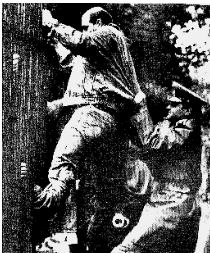
Billedet er fra den Vesttyske Ambassade i Prag. Tjekkiske betjente forsøger at hindre en østtysker i at søge beskyttelse på ambassaden.

Her henvendte mange asylsøgere sig på vestlige ambassader og henviste til CSCE-erklæringen om retten til fri udrejse.