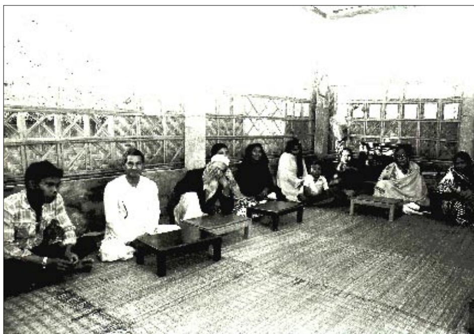
Udsnit af forældreskaren ved et forældremøde.

Dette fik som konsekvens, at en gruppe forældre med forebyggelse som emne i samarbejde med Folkekirkenes Nødhjælp drog på turné i omegnen.