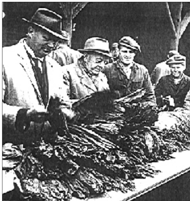
Tobaksblade undersøges inden det går løs på auktionen i Odense.

Derfor blev det nødvendigt at vende bladene med jævne mellemrum. Ribberne skulle fjernes fra de tørrede blade, som derefter skulle skæres ud, alt efter om de skulle anvendes til cigaretter – pibetobak, cerutter eller cigarer. Tobak til cigaretter blev skåret i fine strimler, men den danske tobak havde tilbøjelighed til at smuldre, hvilket absolut ikke forhøjede nydelsen.