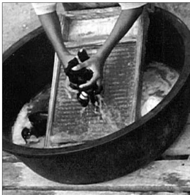
Når mor til fyraften var færdig med at skure tøj på vaskebrættet, var hænderne fulde af vabler og sår. Billedet tog jeg i Honduras i 1998.