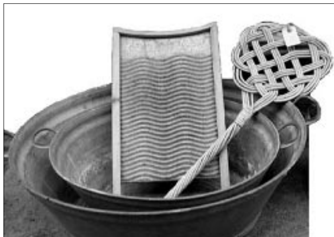
Billede er fra Den Gamle By i Århus; zinkbaljer, vaskebræt og tæppebanker vigtige værktøjer for datidens husmødre.

I slutningen af krigen, hvor et par mistede underbukser betød, at man måtte gå med bar røv, organiseredes frivillige vagtkorps. Kriminaliteten vanskeliggjorde på mange måder modstandsarbejdet, da alle vogtede på alle. En betingelse for os var, at vi så ubemærket som muligt kunne færdes uset til og fra de depoter, hvor vi gemte våben og sprængstoffer.