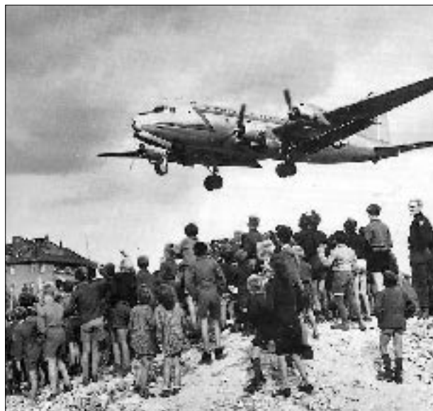
Berlinere beundrer en vanskelig landing