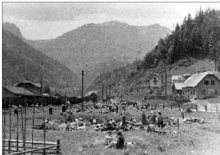
Brigaden camperer i det fri